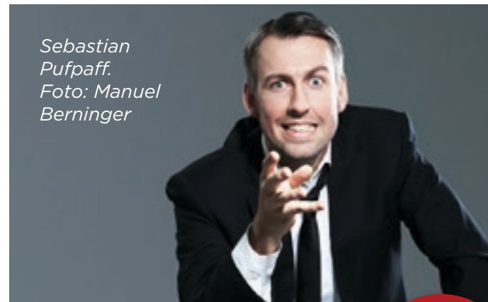
Sebastian Pufpaff.

Mir fällt es besonders leicht, den ganzen Tag mit meiner Familie zusammen zu sein, das Glück im Moment zu sehen und auch mittags schon mal einen Grauburgunder zu trinken.