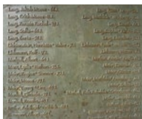
Gedenkstein im ehemaligen Sammellager Much

Das Judentum kann im Rheinland auf eine lange Tradition zurückblicken. Bereits im Hochmittelalter lassen sich für das Gebiet des heutigen Rhein-Sieg-Kreises jüdische Bewohner nachweisen. Aber schon während der Kreuzzüge kam es an vielen Orten in Deutschland zur Verfolgung und Ermordung von Juden. In der Folgezeit wurden die Juden unter Schutz gestellt, den sie mit hohen Abgaben zu erkaufen hatten. Um die Mitte des 14. Jahrhunderts kam es unter König Karl IV. zu weiteren schwerwiegenden Verfolgungen. Die Existenz der Juden unterlag einer ständigen Gefährdung, und bis zum Ende des 15. Jahrhunderts wurden sie aus fast allen deutschen Städten vertrieben. Die meisten von ihnen wanderten nach Osteuropa aus. Nach einer fast 200-jährigen Unterbrechung wurden in der 1. Hälfte des 17. Jahrhunderts in der schriftlichen Überlieferung wieder Juden im heutigen Rhein-Sieg-Kreis erwähnt. Seitdem wuchsen die jüdischen Gemeinden stetig. In fast allen Städten und Gemeinden unserer Region existierte bis zum nationalsozialistischen Holocaust ein blühendes jüdisches Leben. Jüdische Bürger lebten Haus an Haus mit Bürgern anderer Konfessionen.