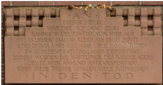
Gedenktafel am Bahnhof Köln-Deutz

Bereits unmittelbar nach der Machtergreifung der NSDAP im Januar 1933 wurden die jüdischen Mitbürger in Deutschland durch eine Vielzahl gesetzlicher Maßnahmen drangsaliert, diffamiert und entrechtet, ihr Lebensbereich immer weiter eingeschränkt. Mit den sog. „Nürnberger Gesetzen“ vom September 1935 war