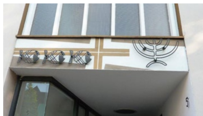
Menora über dem Hauseingang