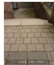
Treppenabgang am Bahnhof Köln-Deutz

ein Instrument geschaffen, die Juden rechtlich zu verfolgen und sie ihrer politischen Rechte zu berauben. Mit dem Pogrom vom 9. auf den 10. November 1938 ist jüdisches Leben auch im Rheinland nach und nach endgültig zerstört und ausgelöscht worden. Auch die Honnefer Synagoge fiel der Pogromnacht 1938 durch Brand zum Opfer. Die endgültige staatsbürgerliche Entrechtung und der letzte Akt der Entfernung der Juden aus der „deut-